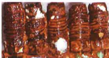
Zn+3価クロメート処理品