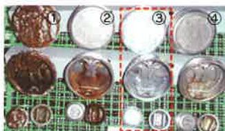
①鉄+Zn(8μm)+六価有色Cr ②SUS410+パシベート処理 ③ LonGood Shine ④SUS304+パシベート処理