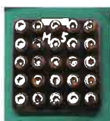
ノンクロム亜鉛系複合皮膜